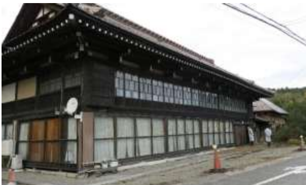
断腸の思いで決断し、解体順番待ちの古民家