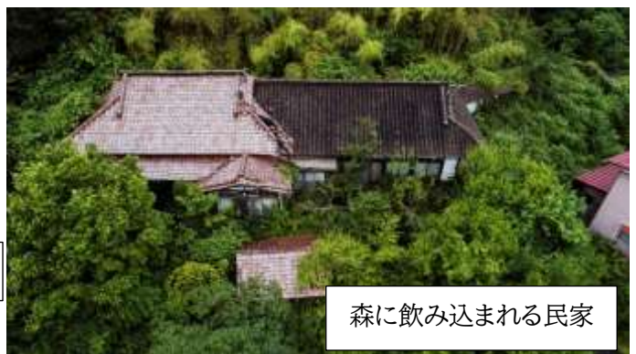
森に飲み込まれる民家