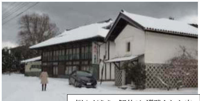
悩んだうえ、解体せず残された家