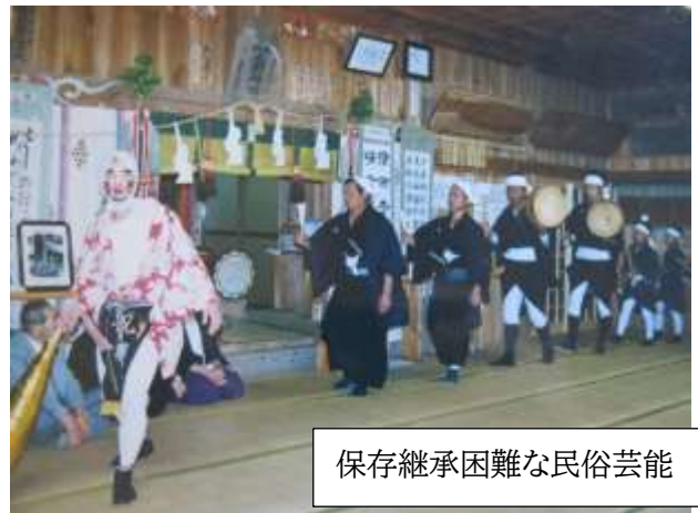
保存継承困難な民俗芸能