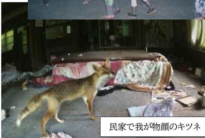
民家で我が物顔のキツネ