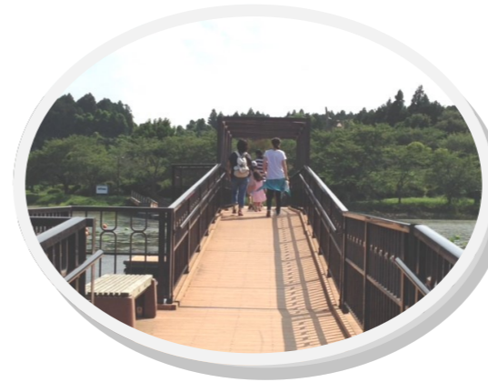
平筒沼の棧橋にて

7月12日～13日までの二日間、宮城県登米市にある「手のひらに太陽の家」に、3家族、8名(大人4名、子ども4名)と共に保養プログラムを行いました。