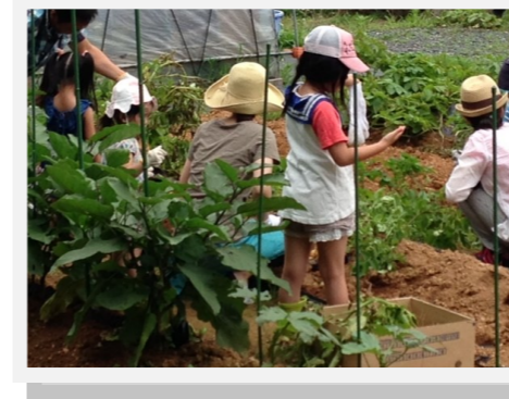
みんなでジャガイモほり!

(「あいコープみやぎ」さんは、食物の放射能を自主測定し、国の基準よりさらに厳しい「自主基準」を設けており、その結果を公開しています。)献立は、栄養士の資格を持ったボランティアスタッフによるもので、栄養のバランスを考えられた食事となりました。ボランティアスタッフと参加者全員で料理作りを行いました。